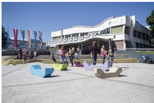
Beispiel für Metamorphopsie

Unter Metamorphopsie (gr. "metamorph"="umgestalten", "opsie"="sehen") versteht man die veränderte oder verzerrte Wahrnehmung der Umgebung. Ursachen für diese Sehstörung können unter anderem physische Schäden des Auges, meist aber der Netzhaut (z.B. nach einer Netzhautablösung oder bei Vorliegen einer Makuladegeneration), sein.