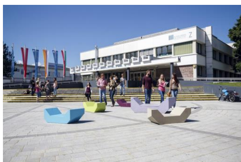
Gewünschter Output der VR-Brille